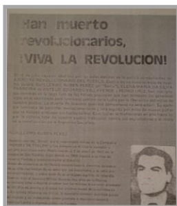
Imagen 3 “Han muerto revolucionarios, ¡viva la revolución!” Estrella Roja , 37, 1974, 5

La guerrilla comenzó a tener muertos en sus filas muy tempranamente. Una de las formas de honrar a esos muertos caídos en combate fueron los obituarios aparecidos en la prensa, que no sólo los honraban convirtiéndolos en héroes y mártires de la revolución, sino que también los exhibían como modelos a seguir. Las fotografías que acompañan los obituarios son imágenes extraídas de documentos de identidad, en las que sólo vemos los rostros de los militantes caídos. A diferencia de la serie de los cuerpos armados, estas notas no exhiben las figuras de unos soldados sino las de unas personas comunes y corrientes, de unos ciudadanos. En contraste, es el texto escrito el que nos indica que estos muertos son héroes de la lucha armada, que han arriesgado y perdido sus vidas por la revolución. Por ejemplo, en el recuadro: “Han muerto revolucionarios, ¡VIVA LA REVOLUCION!” (Imagen 3), se rinde homenaje a cuatro militantes.