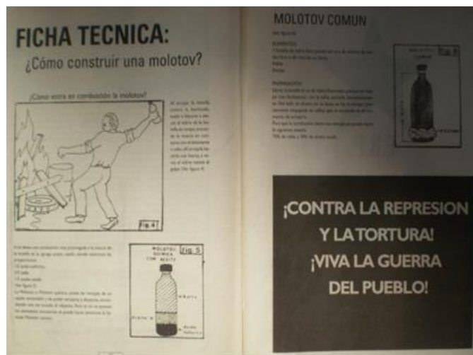
Imagen 2 “¿Cómo construir una Molotov?” Estrella Roja , 8, 1971, 6-7

Los elementos necesarios son una botella de vidrio, nafta, estopa. La preparación: “Llenar la botella (si es de vidrio fino mejor, porque se rompe más fácilmente) con la nafta, cerrarla herméticamente. Del lado de afuera, en su base, se fija la estopa (previamente empapada en nafta) que se enciende en el momento de arrojarla”. 30 El registro infantilizado, que se ve reforzado por los dibujos realizados a mano, genera que un tema —política y éticamente— complejo como es construir y tomar un arma por parte de un sujeto, sea presentado con un tono de ligereza. Este estilo didáctico y la liviandad con la que se trata el tema tienen el efecto de desestimar la envergadura del hecho armado a la vez que parecen postular que cualquiera puede convertirse en un revolucionario. Cualquiera puede aprender