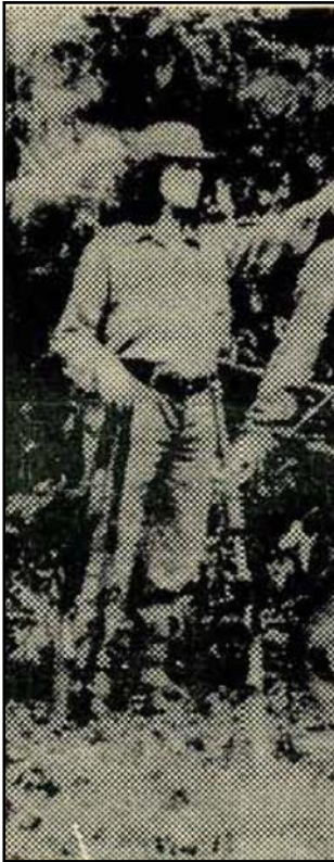
Imagen 6 “Carta de una compañera a sus padres” Estrella roja , 66, 10

Estos dos artículos, muestran una diferencia respecto de las nominaciones tradicionales de la mujer militante, que se observaban en los discursos en los que las mujeres aparecían como destinatarias o tema del enunciado. No obstante, estos desplazamientos fueron rápidamente reenviados hacia posiciones más clásicas. Tomando a la experiencia vietnamita como modelo, la figura de la guerrillera que predominó, la cubría con las características femeninas tradicionales, una madre, con un niño en un brazo y un fusil en otro, o una mujer bella. La imagen de la madre vietnamita central en el imaginario de la organización, aunque apareció pocas veces en la prensa, quizás sea la que mejor representa el modo en que el partido entendió la unión entre mujer y arma, entre mujer y combatiente, entre mujer y política. En esa imagen la maternidad es la que está en primer plano, se trata de una mujer dándole el pecho a su niño. El fusil también está presente, pero atrás como escondido (Imagen 7).