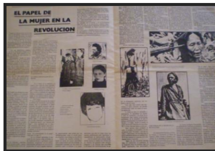
Imagen 5 “El papel de la mujer en la revolución” El Combatiente , 157, 175, 8-9

Las tareas mencionadas lejos están de evidenciar cambios respecto de las realizadas tradicionalmente por las mujeres en el capitalismo. En los términos de este artículo, la emancipación femenina sólo se circunscribiría a la realización de tareas de madre y de esposa. Aquello que no aparece enunciado es el vínculo propio de las mujeres con la política. Esta imposibilidad quizás sea el resultado de otra gran ausencia, la de las mujeres como enunciadoras. Es un texto que trata sobre las mujeres en la revolución pero que posee un enunciador masculino. Las mujeres son habladas por otros.