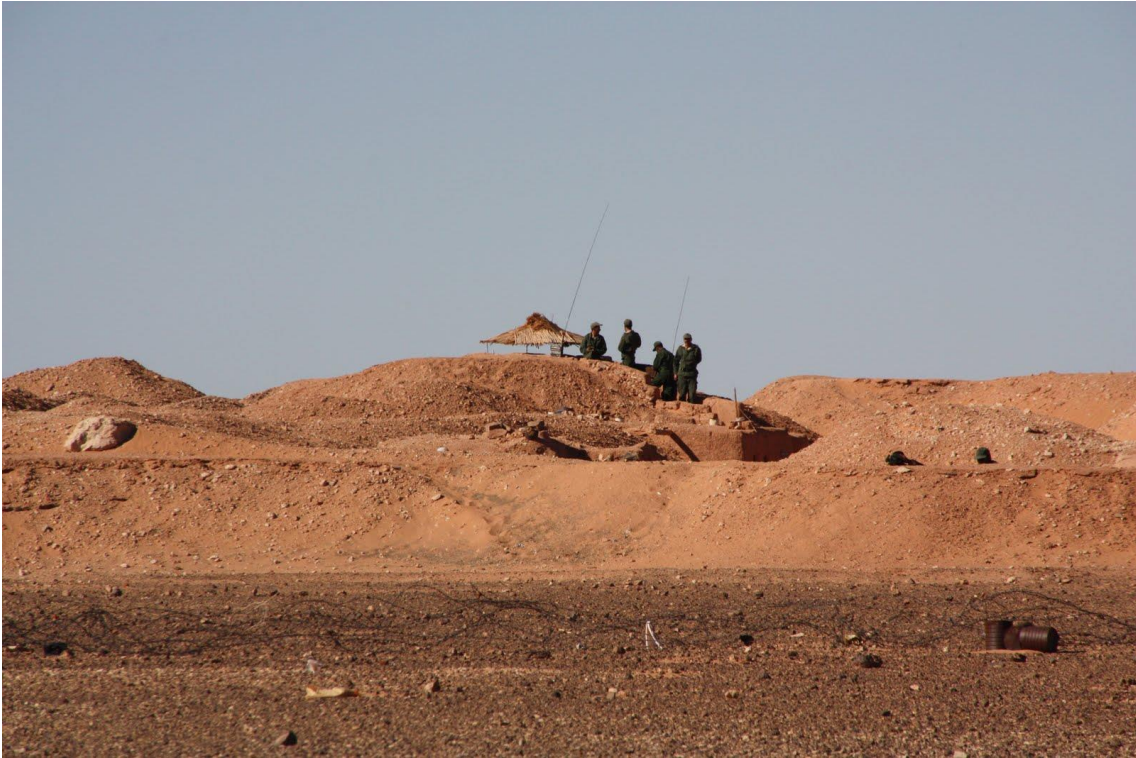
Puesto de control marroquí en el 'muro de la vergüenza'.