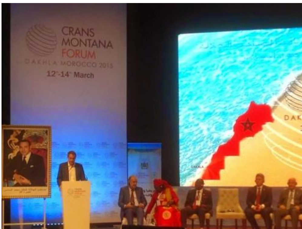
José Luis Rodríguez Zapatero en el Foro Crans Montana, en Dajla ocupada

Nuestro actual presidente, Pedro Sánchez , también está demostrando dedicarse a eso (véase la web contramutis.com ), como si el crecimiento del PIB marroquí fuera una prueba de justicia y descolonización. Ya el expresidente José Luis Rodríguez Zapatero acudió a los eventos propagandísticos que el Majzén promueve en los territorios ilegalmente invadidos y ocupados; e incluso, fue fotografiado ante un mapa de Marruecos con el Sáhara Occidental anexionado, lo que le valió la descalificación del entonces ministro de Exteriores, José Manuel García-Margallo (PP): Celebrar reuniones internacionales en territorios ocupados es «ilegal conforme al derecho internacional» . 107