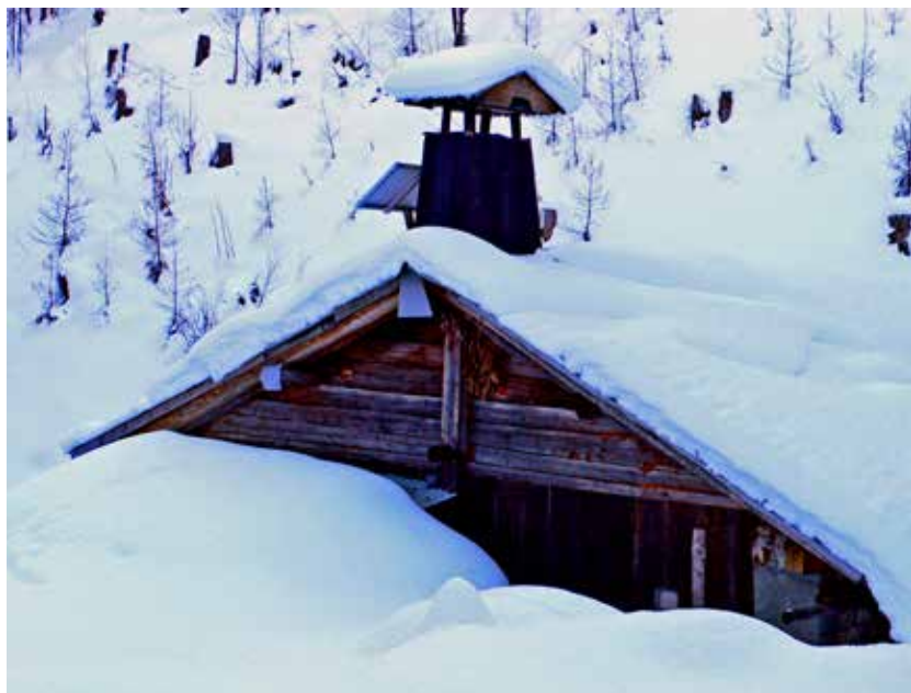
Cabaña alpina cubierta de nieve

La décima parte de la tierra que emerge sobre los océanos está cubierta de agua helada, variando la extensión en zonas donde en verano se funde. La criosfera, superficie del planeta que permanece cubierta de agua en forma sólida, abarca los casquetes polares, territorios helados, glaciares y espacios cubiertos de permafrost. La mayor superficie de territorio helado se encuentra en el hemisferio norte. El mayor volumen de agua helada está en la Antártida, con hielos profundos de miles de años. El 90% del agua dulce helada cubre la Antártida, y gran parte del 10% restante Groenlandia. Tres cuartas partes del agua dulce del planeta está siem-