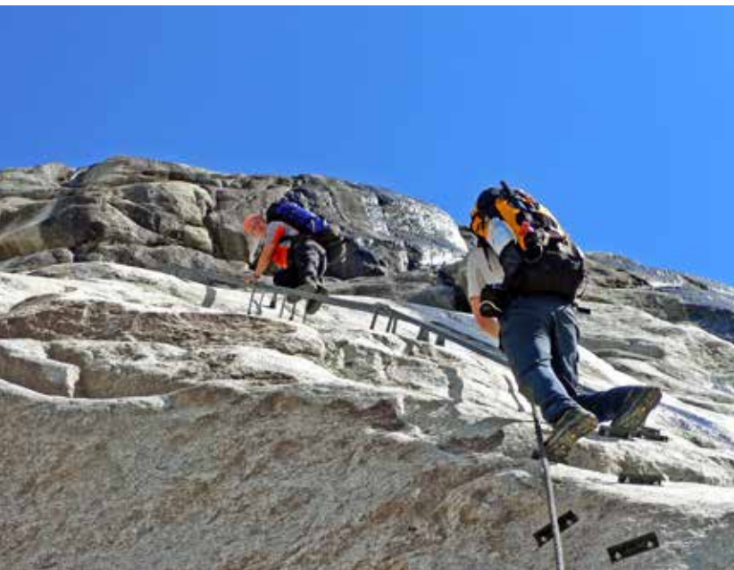
Escala de acceso al Refuge Leschaux

Cuando visitamos por primera vez el glaciar Aletsch en los Alpes Berneses para ascender a la Jungfrau (4158 m), que significa virgen o doncella (Pyrenaica N° 94, 1974), nos sorprendió que el refugio Konkordia estuviese unos 100 metros por encima del lecho del glaciar. Al inaugurarse en 1877 eran 50 metros, en la actualidad 200. Sin ser conscientes de ello, éramos testigos de la regresión de los glaciares, que no sería noticia asociada al cambio climático hasta muchos años después. El glaciar Grosser Aletsch abarcaba entonces 25 km de longitud, ahora 23 km escasos.