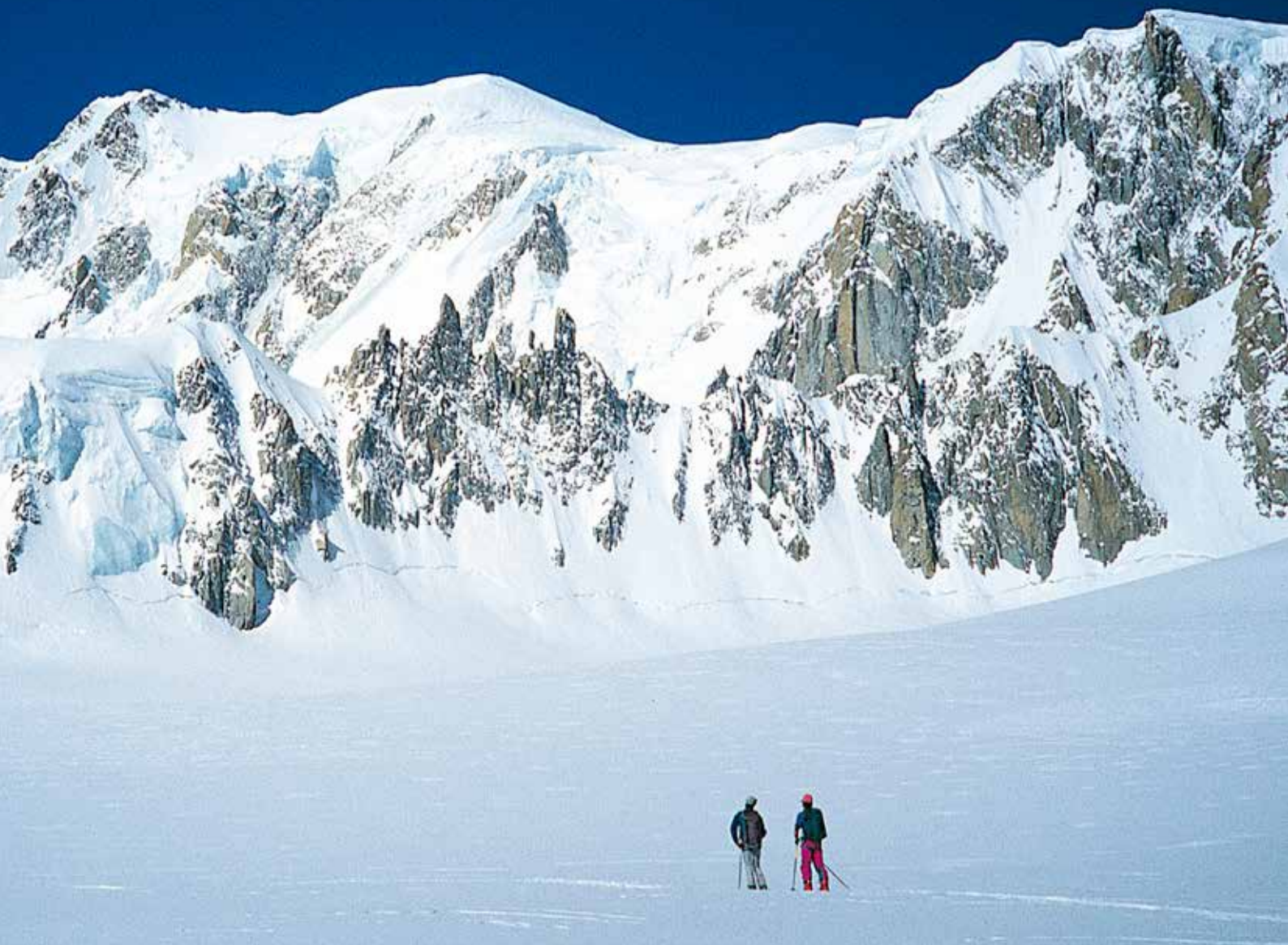
Mont Blanc, Glacier du Géant, descenso invernal Valle Blanco

Las catástrofes provocadas por el derrumbe de glaciares tienen una larga historia. En 1965 una avalancha del glaciar del Allalin sepultó en Saas-Fee (Suiza) los barracones donde se alojaban 88 trabajadores, la mayoría italianos, que construían el embalse del Mattmark. En julio del 2022 la tragedia afectó al glaciar de La Marmolada, en los Dolomitas. Las aguas que se filtran y circulan por el interior del glaciar formaron un inmenso depósito. Al reventar, como el dique de un embalse, la avalancha de agua, hielo y roca produjo 11 víctimas mortales.