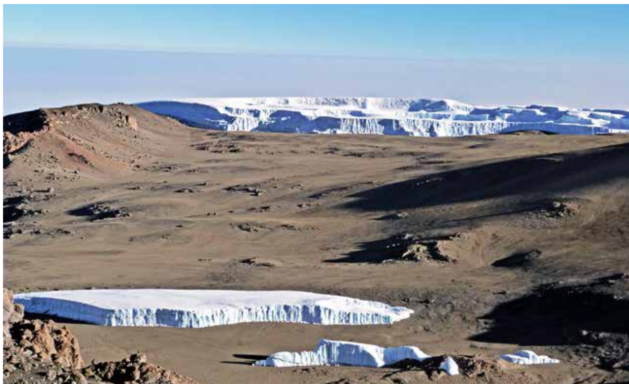
Restos glaciares en el cráter del Kilimanjaro

Cerca del 20% del territorio emergido del planeta está cubierto por una capa de hielo de variable espesor. En Alaska y Siberia llega hasta 600 metros de profundidad. El per-