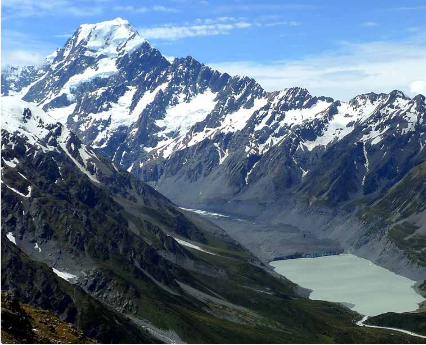
Mount Cook, lago y cuenca del Glacier Hooker, desde Mount Ollivier

culos de hielo de esa red de glaciares se utiliza equipamiento de vía ferrata. La progresión por terreno rocoso está resuelta con peldaños y escalinatas, tornándose delicada en laderas inestables y graveras de morrenas. La fusión del permafrost derrite la capa de hielo superficial, perdiendo estabilidad las laderas. Bajar por ellas supone un ejercicio expuesto a caídas serias. Es el caso del comprometido descenso del Refuge d'Anvers des Aiguilles al Glacier du Tacul. En aquella fecha (2008) la fusión del hielo comenzaba a 2800 metros, ahora la línea de equilibrio se sitúa en la cota 3100.