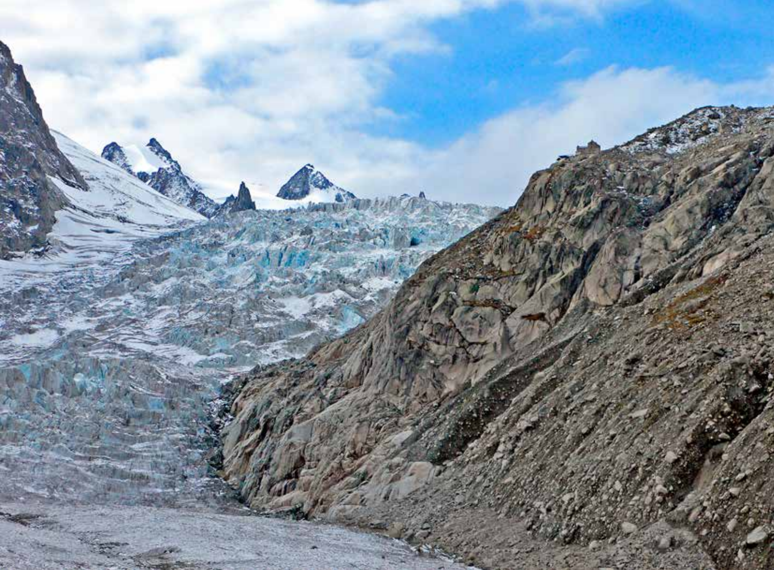
Glacier du Géant, cresta derecha Refuge du Requin, desde Mer de Glace

supuesto pirenaicas. Pese a todo, persiste el empeño en seguir urbanizando la montaña. En el Pirineo se intenta unir Astún y Formigal destruyendo la Canal Roya, y abrir nuevas pistas en Castanesa, al pie del Aneto.