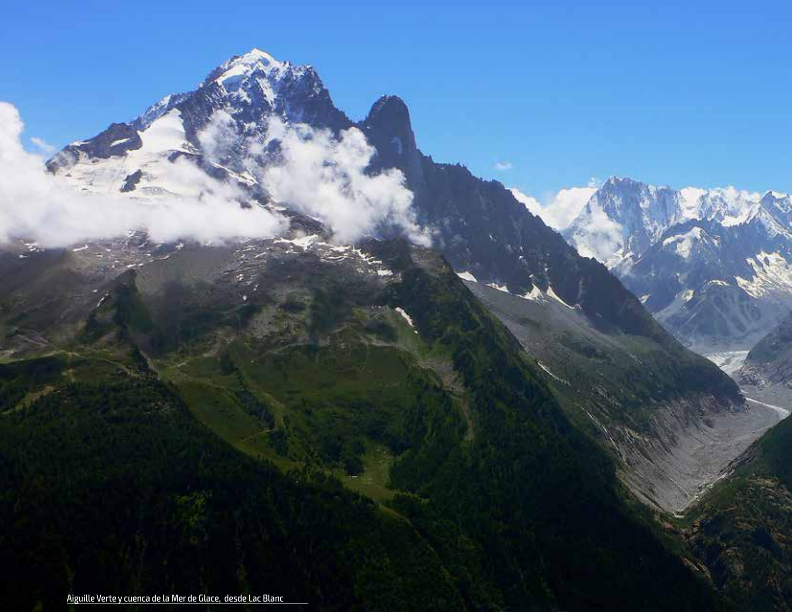
Aiguille Verte y cuenca de la Mer de Glace, desde Lac Blanc