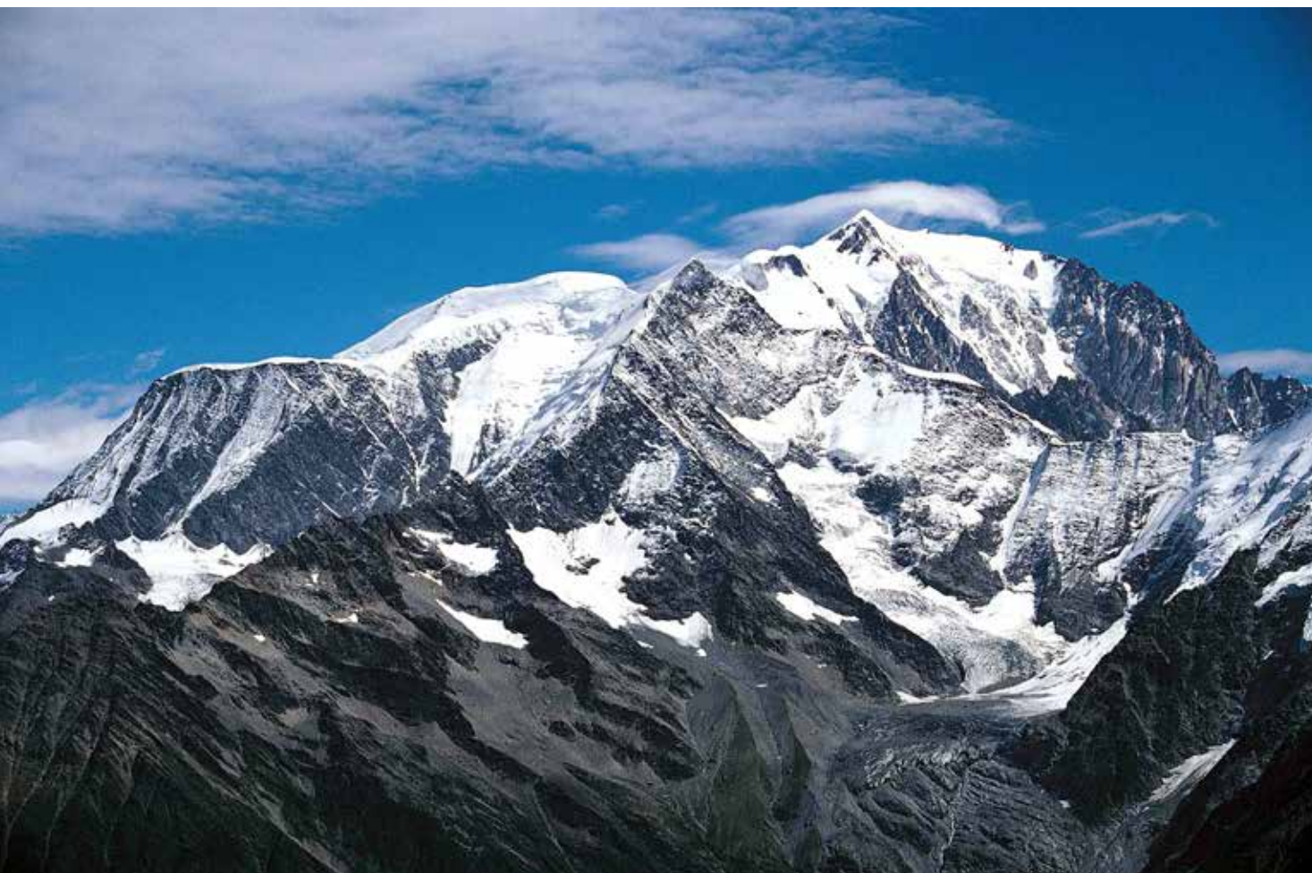
Cresterío de la vía normal del Mont Blanc, desde el Mont Joly

Durante el verano del 2020 en el círculo polar ártico siberiano se llegó a 38^{\circ}\text{C} y se produjeron enormes incendios. Desde el siglo XIX la temperatura media de los Alpes ha aumentado en 2^{\circ}\text{C} , el doble que en el conjunto del planeta. La nieve llega más tarde y se funde antes. Esa carencia se intenta suplir en las estaciones de esquí con unos 100 000 cañones de nieve. Incluso se instalan depósitos que recuerdan las neveras naturales de antes de existir los frigoríficos y el hielo industrial. Las estaciones de esquí están condenadas a desaparecer a corto plazo. En enero del 2023 la prensa se hizo eco de la escasez de nieve en estaciones alpinas y por