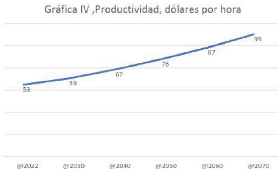
IV. Productividad en dólares por hora.

¿Cuál es el secreto de esta evolución? La OCDE calcula la productividad por hora trabajada en el Estado español en el año 2022 en 53 dólares . La CE estima que se incrementará en un 1,3% anual. Recordemos la potencia del interés compuesto durante un período de 48 años (2022-2070).